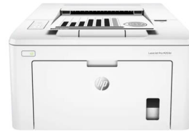
HP 레이저 젯 프로 M203DW