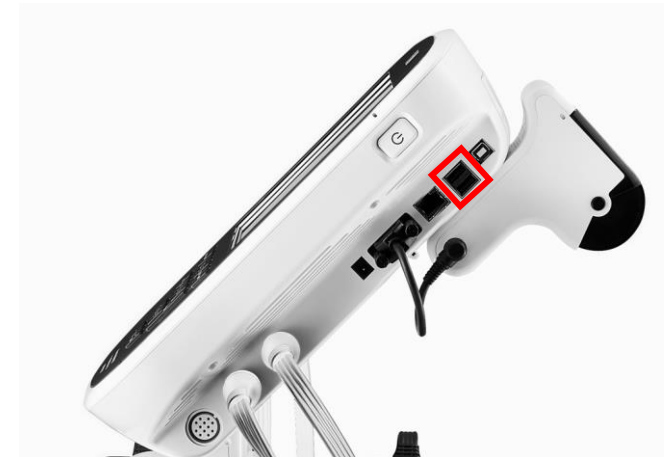
프린터 케이블 연결 단자