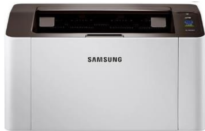
삼성 SL-M2027W * 370SDM-0401 버전 이상 호환 * 무선으로 사용 가능