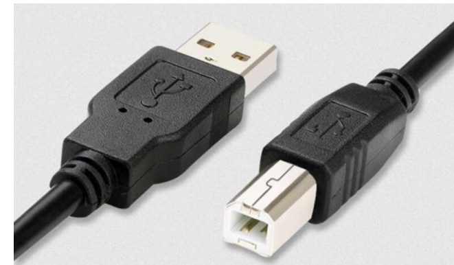
프린터 케이블 연결 단자